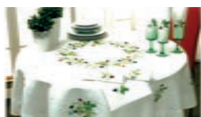
Tovaglia Nives by Baldini e Cecchi

Baldini e Cecchi è un nome storico nel mondo del ricamo artistico per la casa Made in Italy. L'atelier nasce a Buggiano (PT) nel '62 dall'iniziativa della disegnatrice Nives Baldini Cecchi, a cui si aggiunge la boutique monomarca presente a Portofino da oltre 25 anni. Ogni capo grifato "Nives by Baldini e Cecchi" è unico, progettato a mano e realizzato tramite antiche tecniche come telaio, ago e filo e la più recente mano-macchina.