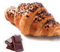
Cornetto cotto al cioccolato

Anche se non lo sapete, Casa Giani vi ha aiutati ad iniziare bene le vostre giornate tante volte, dandovi modo di gustare un cornetto di qualità nel bar vicino casa. È dagli anni '80, infatti, che produce e distribuisce cornetti e prodotti per la colazione in tutta Italia.