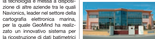
La sede del Tacchificio Fidia

zione di veicoli. I prodotti GeoMind sono rivolti sia al consumer, con varie App di navigazione 3D orientate all'escursionismo, alla bicicletta, alla vita all'aria aperta in generale, sia al business dove la tecnologia è messa a disposizione di altre aziende tra le quali Navionics, leader nel settore della cartografia elettronica marina, per la quale GeoMind ha realizzato un innovativo sistema per la ricostruzione di dati batimetrici in 3D. Ma la novità più rilevante è il prodotto GeoFlyer VApp, un sistema di authoring per aziende e professionisti che consente di inserire contenuti personalizzati nella mappa 3D, creando così una propria App di navigazione che può essere pubblicata e resa disponibile tramite smartphone o tablet. Sistema che rende più facile agli operatori realizzare guide turistiche, promuovere percorsi culturali, enogastronomici e di ogni altro tipo. - www.geomind.it