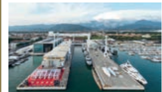
Il cantiere con il bacino galleggiante

Sei Yacht consegnati nel 2014 e altri otto in produzione rendono l'idea della potenzialità produttiva di The Italian Sea Group , leader della nautica internazionale. Con quasi 200 dipendenti, un cantiere che occupa una superficie di 100.000mq e una sede direzionale dove clienti, fornitori e visitatori sono accolti in ambienti Italian Luxury dalle qualità innovative e dal design elegante e ricercato, il Gruppo guidato dall'imprenditore Giovanni Costantino è una delle