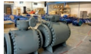
Valvole a sfera per impianti oil&gas

La sede principale è a La Spezia, un'unità produttiva a Cremona, ed una rete di agenti e distributori è dislocata in diversi Paesi del mondo. Con questi "numeri" Euroguarco Spa è leader nella fornitura di prodotti finiti per aziende di importanti settori industriali, fra i quali l'oil&gas, il manifatturiero, i trasporti e quelle delle costruzioni. Alle guarnizioni industriali, valvole a sfera, sistemi e componenti per il piping, coibenti termici ed acustici ed altri ancora, si aggiungono