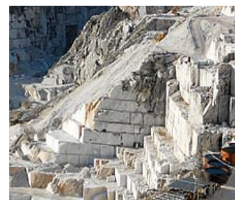
Uno scorcio delle cave