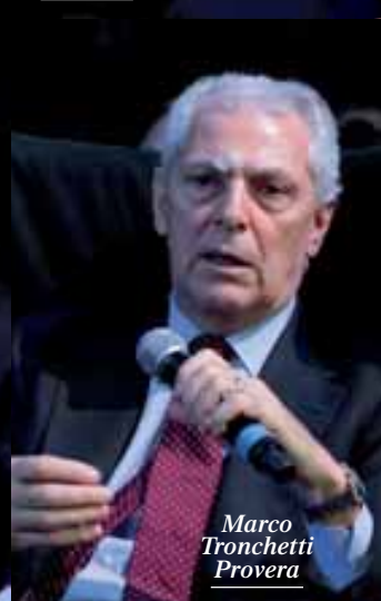
Marco Tronchetti Provera