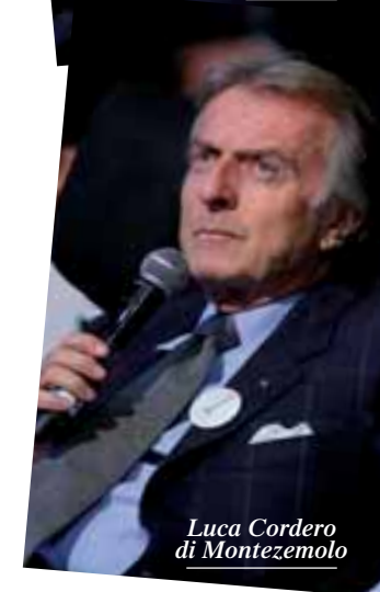
Luca Cordero di Montezemolo