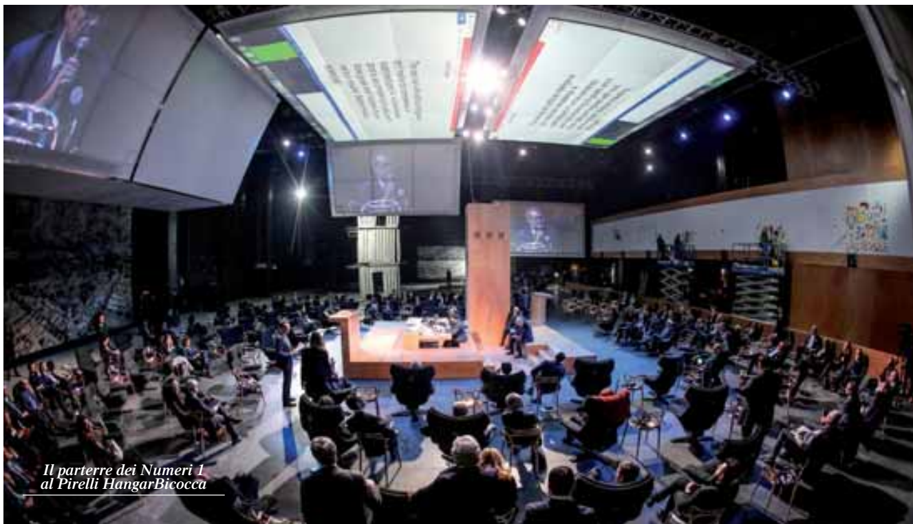
Il parterre dei Numeri 1 al Pirelli HangarBicocca

Il made in Italy può contare sull'industria della cultura e dell'arte, ma non basta. Deve mettere a sistema tutte le sue eccellenze, dal design al saper vivere, e poi colmare le lacune che ha in campo scientifico, per esempio formando i giovani su big data e data science. Il made in Italy ha una base solida nelle imprese piccole e medie, ma anche questo non basta. Piccolo è bello ma il piccolo deve crescere perché il mondo è grande. Insomma, i brand tricolore devono aprirsi al mondo, affrontando la competizione globale e recuperando il tempo perduto. Sono questi i principali binari di sviluppo per la Penisola delineati ieri a Milano durante il Primo Summit dei Numeri Uno d'Italia, organizzato da Class Editori in occasione del 35esimo anniversario del suo mensile Capital . L'incontro tra i principali imprenditori del made in Italy si è svolto al Pirelli HangarBicocca, all'interno dell'Agorà ideata e realizzata dall'architetto Italo Rota. Grazie alla formula del laboratorio, dal titolo #Angar Bicocca. Produciamo il futuro , imprenditori e manager in cinque ore di dibattito costruttivo hanno provato a rispondere, grazie allo scambio di idee e di conoscenze, alle domande più