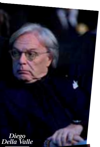
Diego Della Valle